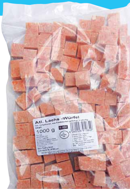
1 kg Beutel