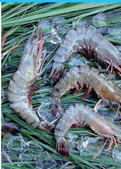
roh, mit Kopf und Schale, 800 g Packung