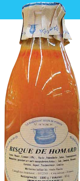
Hummersuppe, 97 cl Flasche