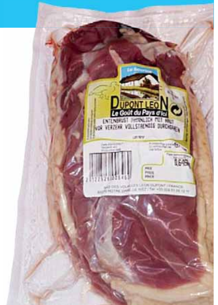
ohne Knochen, mit Haut, 2er verpackt, Packung ca. 300 - 400 g,