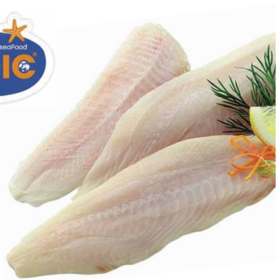
Filet-Stücke ca. 60 - 115 g, 800 g Beutel