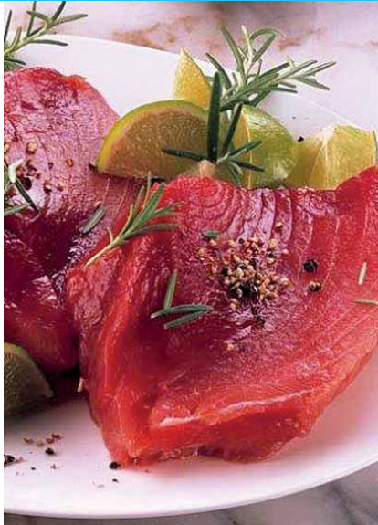
Stück ca. 3 kg